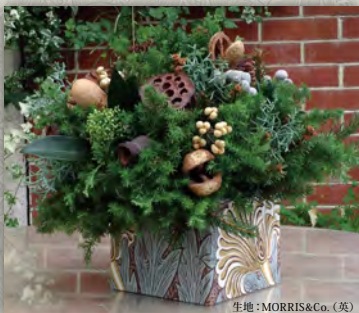
生地: MORRIS&Co. (英)