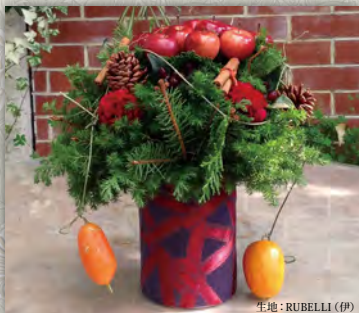
生地: RUBELLI (伊)